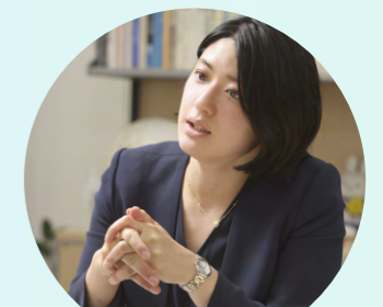
大分STEAM教育推進コーディネーター

今年度の大分県STEAM教育事業のテーマは、「From OITA, To the Future.」です。正解がひとつではない今の時代、「イマジネーション(想像)」や「クリエイション(創造)」といった力が、これまで以上に求められています。このプログラムでは、普段とは違う出会いや経験を通して、自分で考え、仲間と一緒に挑戦することの楽しさを体感できます。ワクワクする気持ちを大切にしながら、自分だけの「想像以上の未来」を描いていきましょう!